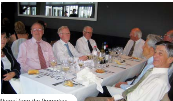
Alumni from the Promotion Henri Le Navigateur (1957/1958)

After the Alumni Association's annual General Assembly, around 250 former students from the College gathered in Concertgebouw in Bruges. They were welcomed by the Rector of the College of Europe and the President of the Alumni Association. The dinner was followed by an unforgettable dance party. Some came from as far as Mexico or the USA to see their friends again, among them, eight celebrated their 50 th promotion anniversary. The youngest re-established a music band from 10 years ago, whose leader has become a professional actress and singer.