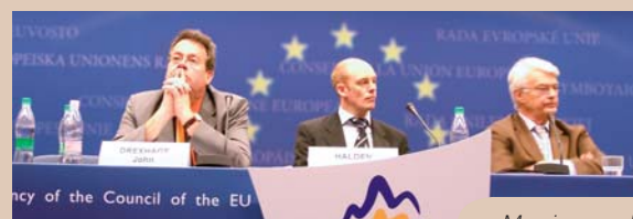
Morning panel, 24 April 2008 workshop

On 24 and 25 April 2008, a two-day event was organised by the Madariaga - College of Europe Foundation and the Folke Bernadotte Academy to analyse the security implications of climate change.