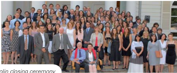
Natolin closing ceremony

The closing ceremonies of the academic year 2007-2008 took place on 19 June in Natolin and on 20 June in Bruges. As in the past, prominent alumni of the College were invited as guest speakers to the ceremonies to share with students their reflections on how their year spent at the College influenced and helped shape their professional careers. In the course of the ceremony best students of the year were named.