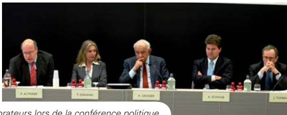
Les orateurs lors de la conférence politique

Les 3 et 4 avril s'est tenu à Bruges un séminaire international sur le thème « Le rôle du tandem franco-allemand dans la relance européenne ». Ce séminaire a été organisé par le Collège d'Europe en partenariat avec l'Institut Franco-Allemand de Ludwigsburg ( http://www.dfi.de/fr/start.shtml ) et avec le soutien financier de l'Organisation Internationale de la Francophonie ( http://www.francophonie.org/ ) ainsi que, entre autres, de Café Babel ( http://www.cafebabel.com/fr/ ) pour la diffusion de l'événement.