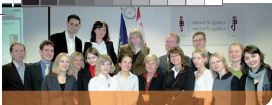
Commissioner Hubner with College students