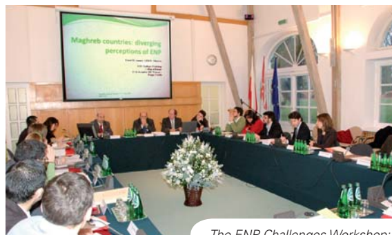
The ENP Challenges Workshop: a debate