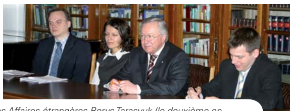
L'ancien Ministre des Affaires étrangères Borys Tarasyuk (le deuxième en partant de la droite) s'adresse aux étudiants du Collège

En mars 2008, les 29 étudiants de la Promotion Politkovskaya/Dink du campus de Natolin ayant opté pour la spécialisation « L'UE comme acteur régional » ont effectué un voyage d'études en Ukraine, à Kiev ainsi qu'à Lviv.