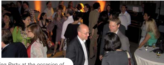
Dancing Party at the occasion of the Promotions Anniversaries

The Alumni from the promotions Henri Le Navigateur (1957-58), Comenius (1967-68), Karl Renner (1977-78), Altiero Spinelli (1987-88) and Hendrik Brugmanns (1997-98) met in a happy and emotional atmosphere on Saturday, 21 June to celebrate their 50 th , 40 th , 30 th , 20 th and 10 th promotion anniversary respectively.