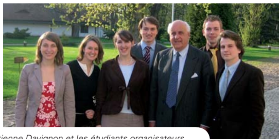
Le Vicomte Etienne Davignon et les étudiants organisateurs