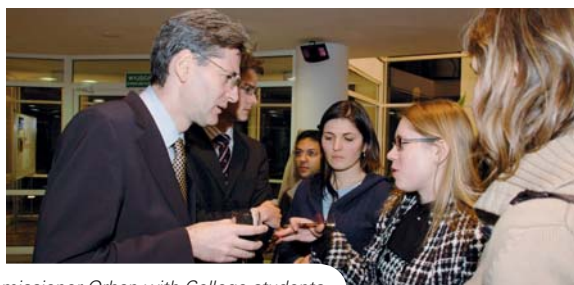
Commissioner Orban with College students

On 6 March, the Vice-Rector welcomed Mr Leonard Orban, Commissioner for Multilingualism, at the Natolin (Warsaw) campus during the study visit of the students of the EU International Relations and Diplomacy Studies programme. Commissioner Orban stressed that the College's students were a fitting audience for his speech entitled "Multilingualism – Essential for the Unity in Diversity of the EU", as they represented "a vivid proof of how multilingualism can build bridges between people from different countries and different cultures".