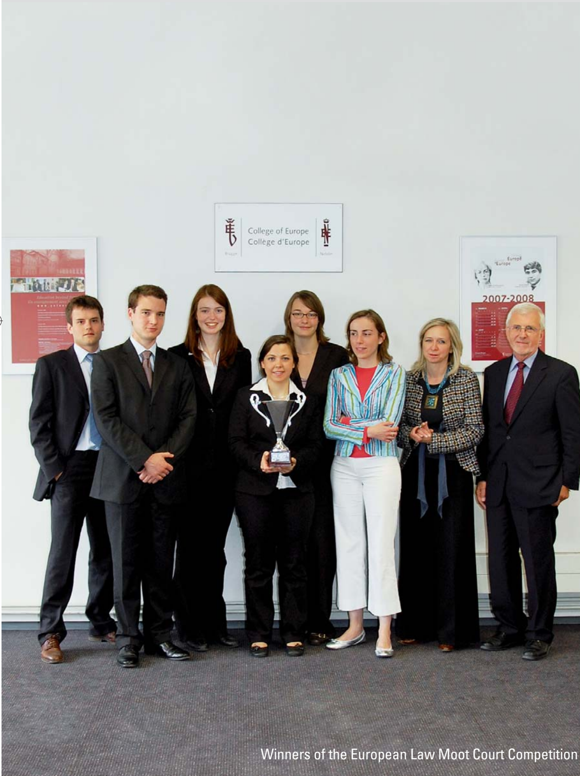
Winners of the European Law Moot Court Competition 2007-2008