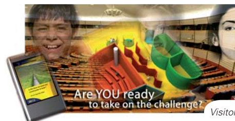
Visitor centre's leaflet

Visitors playing the game will take up the role of Members of the European Parliament. They will have to decide on fictitious proposals for European legislation in important policy areas where the European Parliament has a decisive say. Like in real life, time pressure, various requests from citizens, interest groups and lobbyists, as well as the media, are brought into the game. Arguments have to be won and compromises have to be made. The European Commission and the Council of the EU also play virtual roles in a game that has the ambition to make the basic principle of co-decision in the Union understandable to citizens aged 14 to 84.