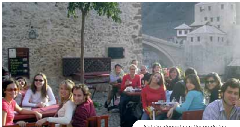
Natolin students on the study trip to Bosnia and Herzegovina

The week of the study trip to the West Balkans, namely Bosnia and Herzegovina, was eagerly anticipated by all Natolinians of the Montesquieu Promotion. However, a thorough preparation was inevitable. Discussions with the Balkan students, diplomats, journalists and academics were organised to familiarise students with the complex situation in the region. The Film Committee did a great job by gathering films treating the Bosnian theme (No mans' land, Welcome to Sarajevo, Before the rain, Gori vatra). The 'reality' presented in those films (to the surprise of some of us) did not differ much from the reality encountered during the trip. The difficult pre-war and war reality led to numerous questions. Some of them were never answered.