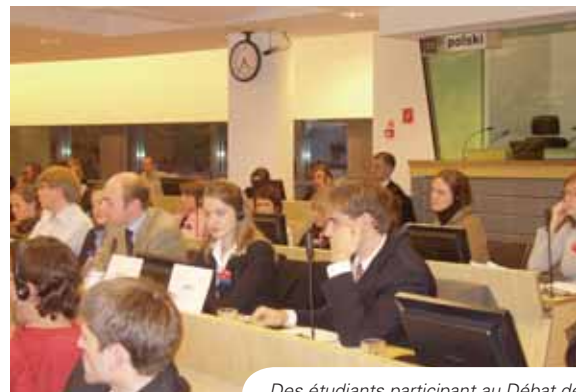
Des étudiants participant au Débat des Jeunes

Les participants ont eu l'honneur de recevoir parmi eux Jacques Delors, l'ancien président de la Commission, qui a tenu à les écouter parler sur ces questions importantes pour le futur de l'Union européenne. Il leur a adressé la parole à la fin, pour souligner l'importance de l'esprit de citoyenneté :