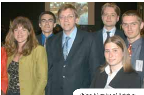
Prime Minister of Belgium Guy Verhofstadt with the finalists