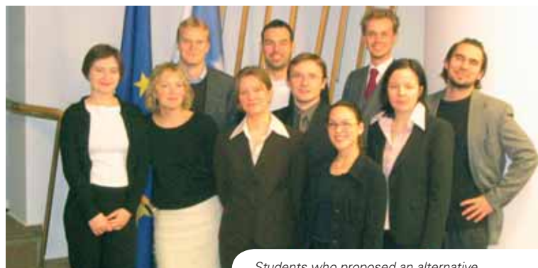
Students who proposed an alternative voting system for the EU

In the wake of the failure of the December 2003 Intergovernmental Conference, ten students of the John Locke Promotion of the College of Europe in Natolin established a working group on voting power in the Council of the European Union. They proposed a triple-majority system based on a square root formula in which a decision would pass with the support of three criteria: at least 50% majority of Members of the Council, at least 60% of weighted votes based on the square root formula, and at least 50% of the EU population. In comparing this model to the Convention model, they found that almost all countries gain in relation to Germany, which continues to be fairly represented. The students transmitted their proposal to the Council of the European Union prior to the decision on the Constitution.