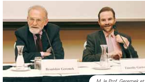
M. le Prof. Geremek et M. Timothy Garton Ash

Dimanche 9 mai 2004 : la Pologne fête son premier Jour d’Europe en tant que membre de l’UE. Le Collège a célébré les journées d’accession et la Chaire de Civilisation Européenne a apporté sa contribution à cette occasion par une grande conférence internationale tenue à Varsovie ce jour-là : Unification de l’Europe : entre passé et avenir .