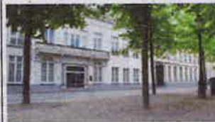
1. Dijver 11