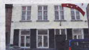
7. Oost-Gistethof 13 & 17