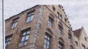
9. Rode Haanstraat 3