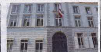
8. Oude Zak 24-26