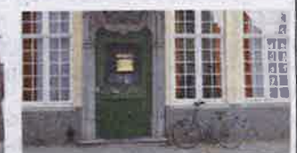
11. Sint-Jorisstraat 49