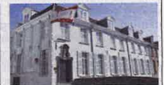
5. Gouden-Handstraat 4