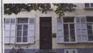
3. Biskajerplein 1