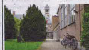
6. Oliebaan 5a