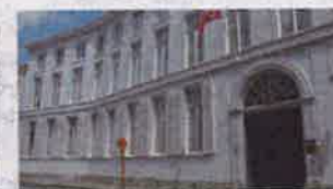
4. Garenmarkt 15