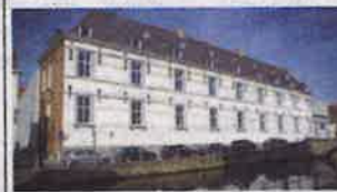
2. Verversdijk 16