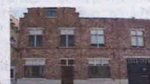
10. Rozendal 30