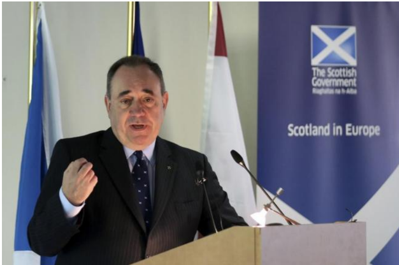
El ministro principal de Escocia dando un discurso, en Bruselas.