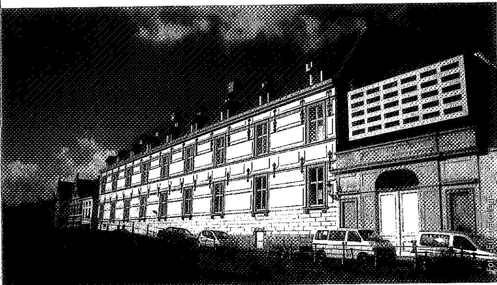
☒ Het gerestaureerde Jezuïetenklooster op de Brugse site Verversdijk verenigt traditionele restauratie met een uitgesproken moderne architectuur.

Zuid-Amerika en Centraal-Amerika om naar het college te komen. Polen doet hetzelfde voor studenten uit Oekraïne en Wit-Rusland. De Vlaamse overheid geeft ook kleine beurzen aan studenten die naar Natolin gaan”.